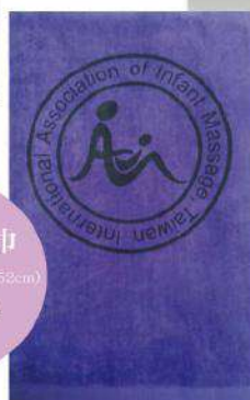
愛的抱抱巾 (MIT 100%純棉70x152cm) 售價/450元