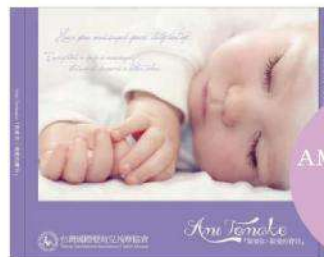
AMI TOMAKE 音樂CD 售價/120元