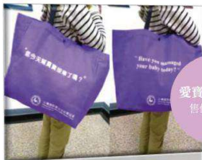
愛寶貝帆布包 售價/ 400元