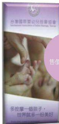
協會DM 售價/ 50份/100元