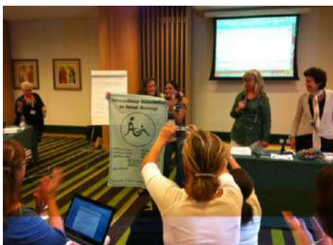
下次再相見，”2014 哥斯大黎加”！