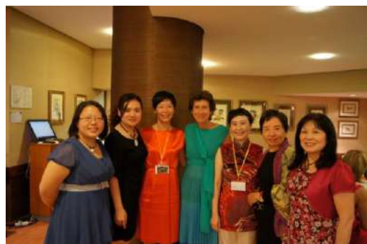
親愛的總會理事長！

百聞不如一見，充電之後的感覺如何？唯有親臨現場才能體會。鼓勵會員們準備下一次的盛會—2014 年中美洲哥斯大黎加國際年會 (Costa Rica)。一定要參加！