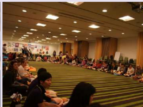
大家圍在一起手法複習。