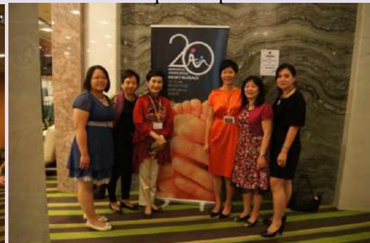
僅次於地主國人數的台灣代表團！