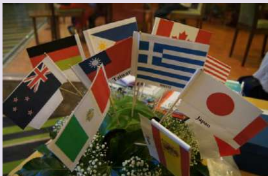
IAIM 大家庭，來自世界每個角落！