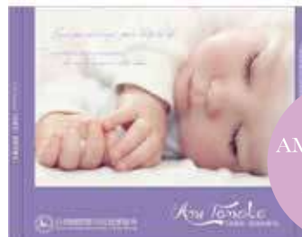
AMI TOMAKE 音樂CD 售價/120元