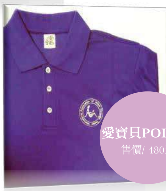
愛寶貝POLO衫 售價/ 480元