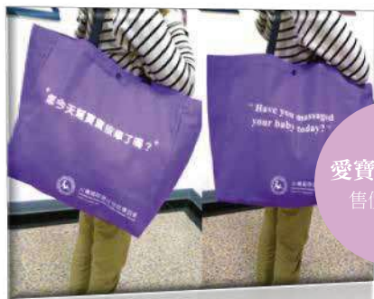
愛寶貝帆布包 售價/ 400元