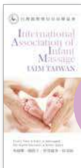
協會DM 售價/ 50份 100元