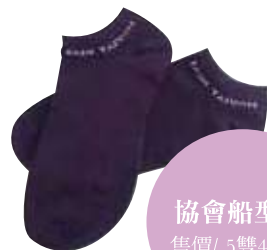
協會船型襪 售價/ 5雙400元